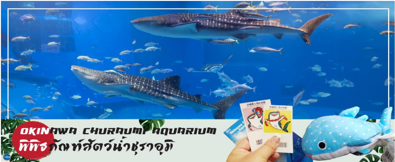
OKINAWA CHURAUMI AQUARIUM พิพิธภัณฑสัตว์น้ำชुरาอุมิ