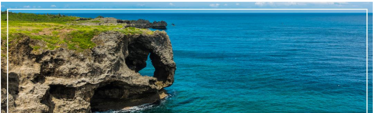
CAPE MANZAMO ผามันซาโมะ

จากนั้นนำท่านเดินทางสู่ ผามันซาโมะ (Cape Manzamo) (ใช้เวลาเดินทางประมาณ 1.20 ชั่วโมง) ผาหินที่สูงชันกว่า 30 เมตรมีลักษณะคล้ายวงช้างหันหน้าสู่ทะเลจีน พื้นที่สีเขียวของต้นหญ้าที่ขึ้นปกคลุมจนถึงยอดหน้าผาดัดกับผืนน้ำทะเลสีฟ้าใส เป็นทิวทัศน์ที่สวยงามที่สุดแห่งหนึ่งในโอกินาว่า ในวันที่ท้องฟ้าสดใสจะสามารถ มองเห็นความสวยงามของเกาะทางตอนเหนือและเกาะที่อยู่นอกชายฝั่ง