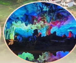
ถ้ำขลุ่ยอ้อ

พักรูกับโรงแรมระดับ 4 ดาว ชมโชว์ดรัมโลโก้หลีเจียง สองเรือที่แม่น้ำหลีเจียง ช้อปปิ้งถนนคนเดินตงซีเซียง