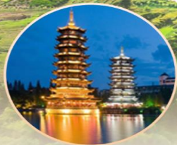
เจดีย์ทอง เจดีย์เงิน

สองเรือแม่น้ำหลีเจียงขึ้นชมวิวทิวทัศน์สุดว้าว ว้าวกับภูเขา Avatar แห่งเมืองหยางชิว “ภูเขาหลุยี่” สัมผัสความงดงามทางธรรมชาติที่ถ้ำขลุ่ยอ้อ ชมโชว์สุดอลัง “ดรัมโลโก้”