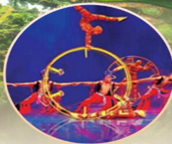
โชว์ดรัมโลโก้