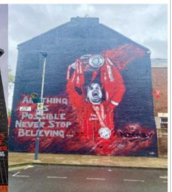
ถ่ายรูปกำแพง Jurgen Klopp และตำนานนักเตะลิเวอร์พูล