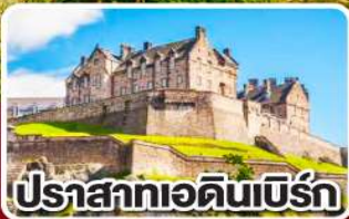
ปราสาทเอดิเนเบิร์ก