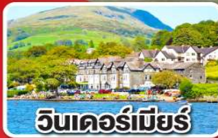
วินเดอร์เมียร์

พิเศษ เมนูฟิชแอนด์ชิพ และเปิดอย่างฟรีซีชั่น