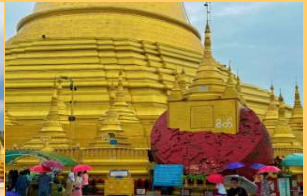
นำคณะเดินทางสู่ เมืองไจ้กัทโย (Kyaikhtyo) ใช้เวลาเดินทางประมาณ 2-3 ชั่วโมง