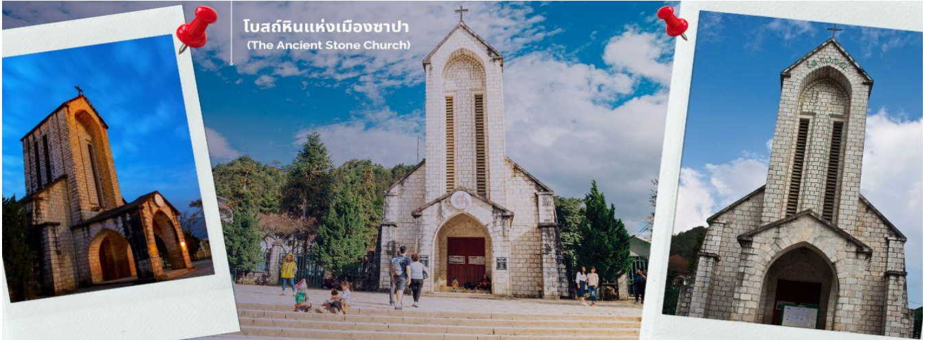
โบสถ์หินแห่งเมืองซาปา (The Ancient Stone Church)

นำท่านช้อปปิ้งที่ ตลาดไนต์เมืองซาปา มีสินค้าให้ท่านเลือกช้อปปิ้งมากมาย ไม่ว่าจะเป็นสินค้าพื้นเมือง ของฝาก ขนม กระเป๋า รองเท้า ท่านสามารถช้อปปิ้งได้อย่างจุใจ