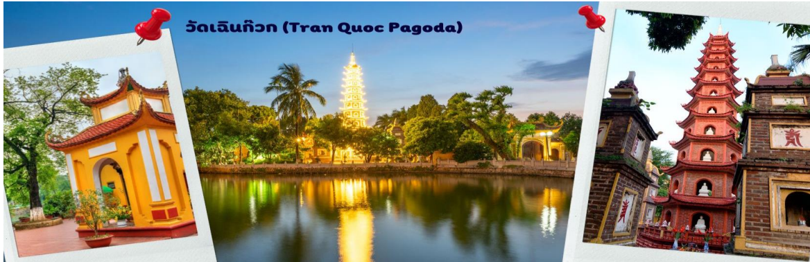
วัดเจ็นกิว (Tran Quoc Pagoda)

ชั้นโดดเด่น มีภาพที่สะท้อนลงสู่ผืนน้ำ เป็นภูมิทัศน์ที่งดงามทั้งยามกลางวันและยามค่ำคืนที่มีการเปิดไฟส่องสว่าง