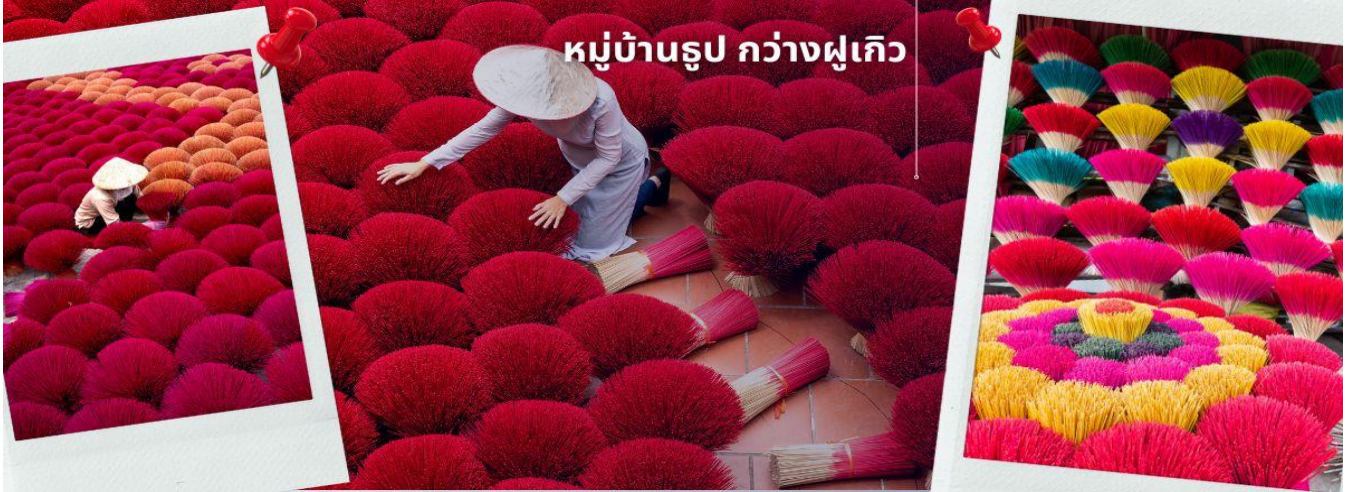
หมู่บ้านรูป กวางฝูเกิว