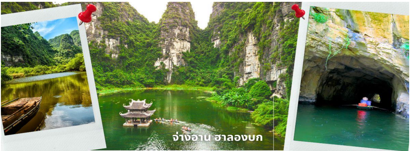
จ่างอาน ฮาลองบก

จากนั้นนำท่านเดินทางสู่ จ่างอาน เป็นพื้นที่ที่มีทั้งภูมิทัศน์อันงดงามของยอดเขาหินปูน แม่น้ำหลายสายไหลลัดเลาะ บางส่วนจมอยู่ใต้น้ำ และยังถูกล้อมรอบด้วยผาสูงชัน จึงทำให้สถานที่แห่งนี้น่าชม การชื่นชมทัศนียภาพที่สวยงามในจ่างอานนั้น คือการล่องเรือเล็กประมาณลำละ 4-5 คนเพื่อเข้าไปเยี่ยมชมจ่างอาน เรือแจวกี่จะพาเราไปเยี่ยมชมวัด หลังจากนั้นก็จะพาเราไปลอดถ้ำ มีทั้งหมด 49 ถ้ำ ซึ่งแต่ละถ้ำจะมีชื่อแตกต่างกันไปจะใช้เวลาล่องเรือไปกลับร่วมสองชั่วโมงเลย ที่เดียว จ่างอานยังถูกเรียกว่า ฮาลองบก เพราะที่นี่มีเขาหินปูนและถ้ำคล้ายกับที่อ่าวฮาลอง