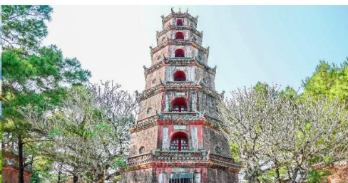
วัดเทียนมู่