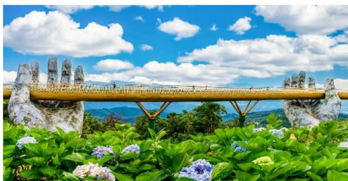
สะพานมือบานาฮิลล์