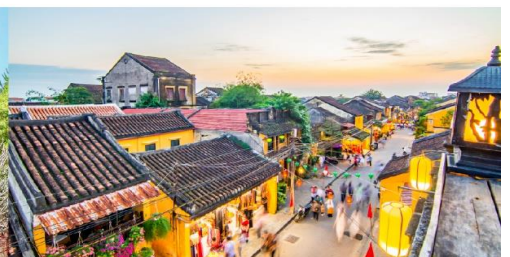
หมู่บ้านฮอยอัน

*กรณีห้องพักรับบานาฮิลล์เต็ม ขอสงวนสิทธิ์ในการเปลี่ยนวันเข้าพัก และปรับเปลี่ยนโปรแกรมโดยคำนึงถึงผลประโยชน์ลูกค้าเป็นสำคัญ