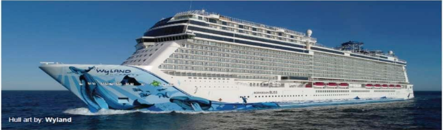
Hull art by: Wyland

Built: 2018 • Gross Tonnage: 168,028 • Guests (Double Occupancy): 4,004 • Overall Length: 1,094ft • Max Beam: 136ft • Crew: 1,716