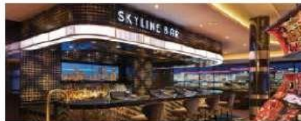
The Skyline Bar