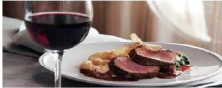
The Manhattan Room

One of three Main Dining Rooms, The Manhattan Room is where guests can enjoy specially curated modern and classic dishes made with the freshest ingredients. Seating capacity: 560