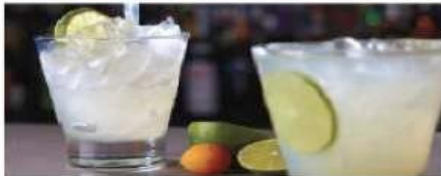
The A-List Bar

The perfect spot to sip a handcrafted cocktail and enjoy the performances from inside The Manhattan Room. Seating capacity: 20