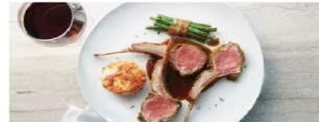
The Haven Restaurant

Savor an exclusive array of dishes for breakfast, lunch and dinner in a private restaurant serving the finest cuisine. Enjoy stunning vistas indoors or al fresco. Exclusively for guests of The Haven. Seating capacity: 98