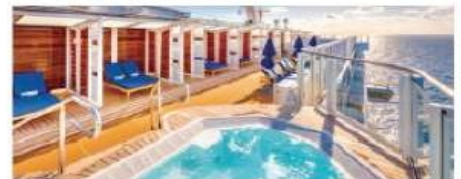
Vibe Beach Club