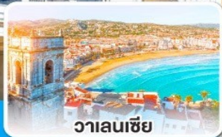
วาเลนเซีย