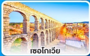
เซโกเวีย