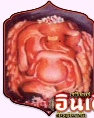
มณฑลจระเข้ อินเดียม อิชฎินายัก