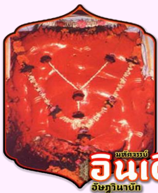
มณฑลจระเข้ อินเดียม อิชฎินายัก

ตั้งอยู่ในถ้ำบนภูเขาริมแม่น้ำกุกติ เมืองเลนยาตรี (Lenyadri) ซึ่งครั้งหนึ่งถ้ำที่ภูเขาแห่งนี้ได้ขุดเจาะเพื่อเป็นวัดในพระพุทธศาสนา หลังจากพระพุทธศาสนาเริ่มเสื่อม ศาสนาฮินดูก็รุ่งเรืองและภายในถ้ำแห่งนี้ก็เกิดปาฏิหาริย์ มีพระพิฆเนศเกิดขึ้นมาทำให้ชาวฮินดูขึ้นมากราบไหว้บูชา จึงทำให้ถ้ำแห่งนี้กลายเป็นถ้ำของพระพิฆเนศ การสักการะองค์พระพิฆเนศ จะต้องขึ้นบันได 283 ขั้น เทวสถานแห่งนี้เล่าว่า พระแม่ปารวตี (พระอูมาเทวี)