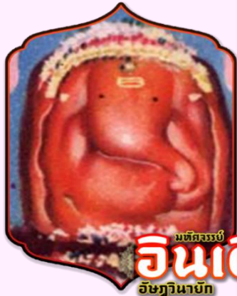
มณฑลจระเข้ อินเดียม อิชฎินายัก

เชื่อว่าผู้ที่มาสักการะองค์ศรีวิฆเนศวรก่อนทำการใดๆ จะทำการนั้นได้สำเร็จราบรื่น ไร้อุปสรรค