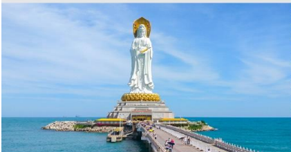
เจ้าแม่กวนอิมหนานชาน