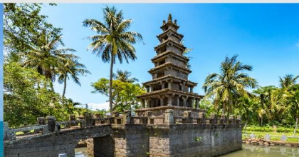
เจดีย์ 2 ฟัน้องหม่ยหลาง