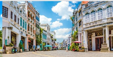
ถนนโบราณฉีหลว

*ทางบริษัทฯ ขอสงวนสิทธิ์ในการสลับโปรแกรมทัวร์ตามความเหมาะสมขึ้นอยู่กับสถานการณ์หน้างาน โดยคำนึงถึงผลประโยชน์ของลูกค้าเป็นสำคัญ