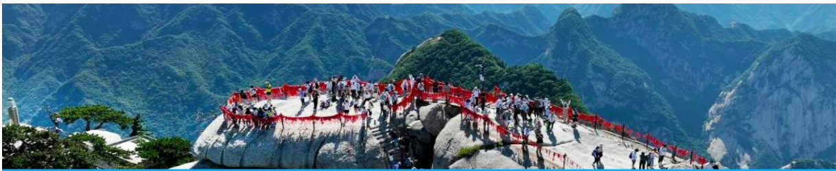
เขาหัวซาน

เช้า รับประทานอาหารเช้า ณ ภัตตาคาร หลังอาหารให้ท่านพักผ่อนตามอัธยาศัยในโรงแรม