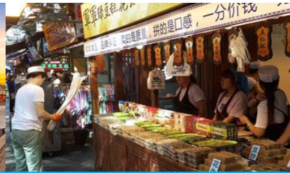
ตลาดมุสลิม