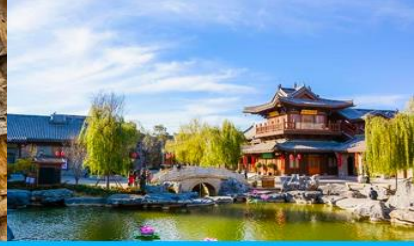
เมืองโบราณลั่วหยี่