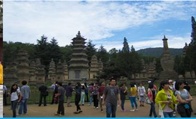
ป่าเจดีย์