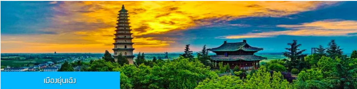
เมืองยูนเฉิง