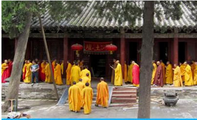
วัดเล้าหลิน