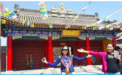
วัดลามะ หรือกว้างเหรินชื่อ

หลังอาหารนำท่านเที่ยวชม Nightless City of Great Tang สถานที่ท่องเที่ยวกลางแจ้งที่สร้างจำลองบรรยากาศย้อนยุคสมัยราชวงศ์ถังที่สุดอลังการ ท่ามกลางแสง สี และคอมไฟที่ประดับอย่างสวยงามตระการตา เป็นที่เช็คอิน ถ่ายภาพยอดนิยมแห่งใหม่ของเมือง ซีอาน พักที่ TITAN CENTRAL PARK HOTEL 4* หรือ โรงแรมในระดับเดียวกัน เมืองซีอาน