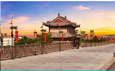
กำแพงเมืองซีอาน