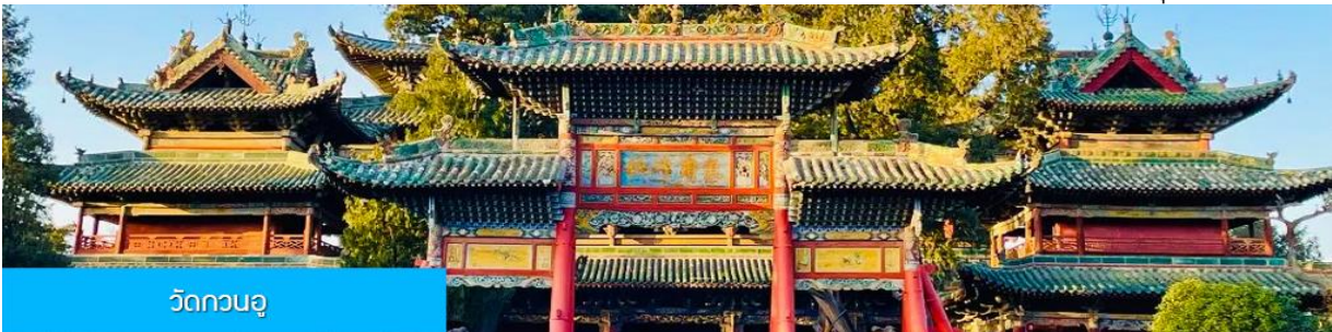
วัดกวนอู

พักที่ A TOUR HOTEL 4* หรือ โรงแรมในระดับเดียวกันในเมืองยูนเฉิง