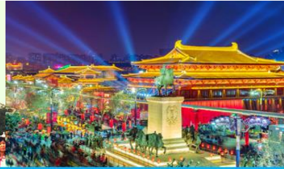
Nightless City of Great Tang

วันที่สี่ เจดีย์ห่าน เมืองหัวซาน-เลือกซื้อโปรแกรมเสริมเที่ยวเขาหัวซาน -สุสานจีนซีฮ่งเต้ -เมืองซีอาน- ป่าใหญ่(ชมด้านนอก) - Nightless city of great Tang