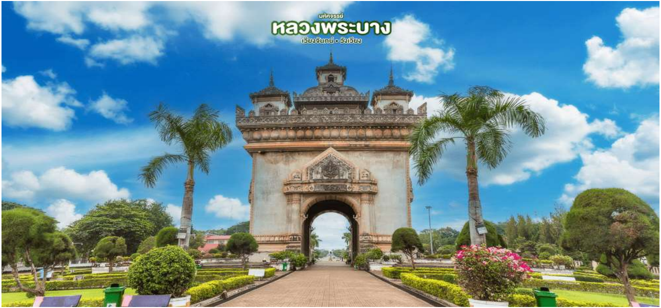
บริษัทจรรยา หลวงพระบาง เวียงจันทน์ • อังเชียง

กลางวัน 📍 บริการอาหารกลางวัน ณ ร้านอาหาร