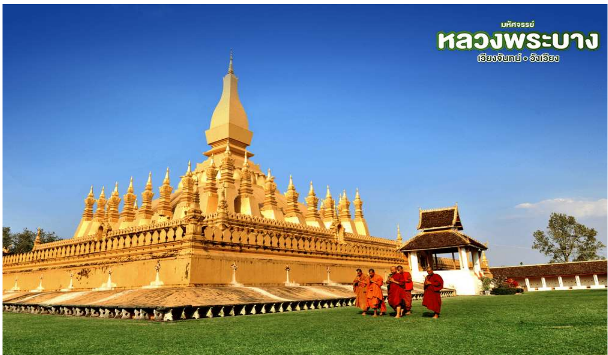
บริษัทจรรยา หลวงพระบาง เวียงจันทน์ • อังเชียง

นำท่าน สักการะ วัดพระธาตุหลวง(THATLUANG PAGODA) เป็นเจดีย์ที่มีลักษณะโดดเด่นที่สุดในอาณาจักรล้านช้าง เป็นการผสมผสานระหว่างสถาปัตยกรรมในพระพุทธศาสนา กับสถาปัตยกรรมของอาณาจักรมีลักษณะคล้ายป้อมปราการมีการก่อสร้างระเบียงสูงใหญ่ขึ้นโอบล้อมองค์พระธาตุไว้พร้อมกับทำช่องหน้าต่างเล็กๆเอาไว้โดยตลอด ประตูทางเข้าเป็นบานประตูไม้ใหญ่ลงรักสีแดงรอบๆองค์พระธาตุยังมีเจดีย์บริวารล้อมอยู่โดยรอบ จากนั้น นำท่านเลือกชม ร้านหัตถกรรมเครื่องเงิน