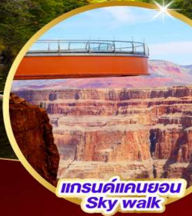
แกรนด์แคนยอน Sky walk