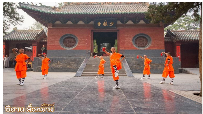
ซีอาบ ลั่วหยาง

เยือน อุทยานป่าเจดีย์ “ถ้ำหลิน” (รวมรถอุทยาน) มีเจดีย์กว่า 200 องค์ ที่มีความเก่าแก่มากกว่า 1,500 ปี เป็นสุสานอดีตของเจ้าอาวาสและหลวงจีนมาตั้งแต่ยุคสมัยของราชวงศ์ถัง