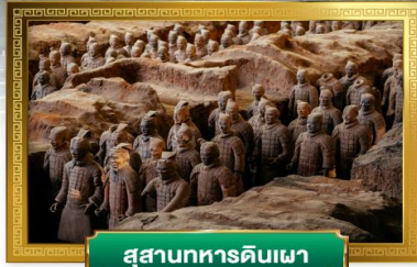
สุสานทหารดินเผา