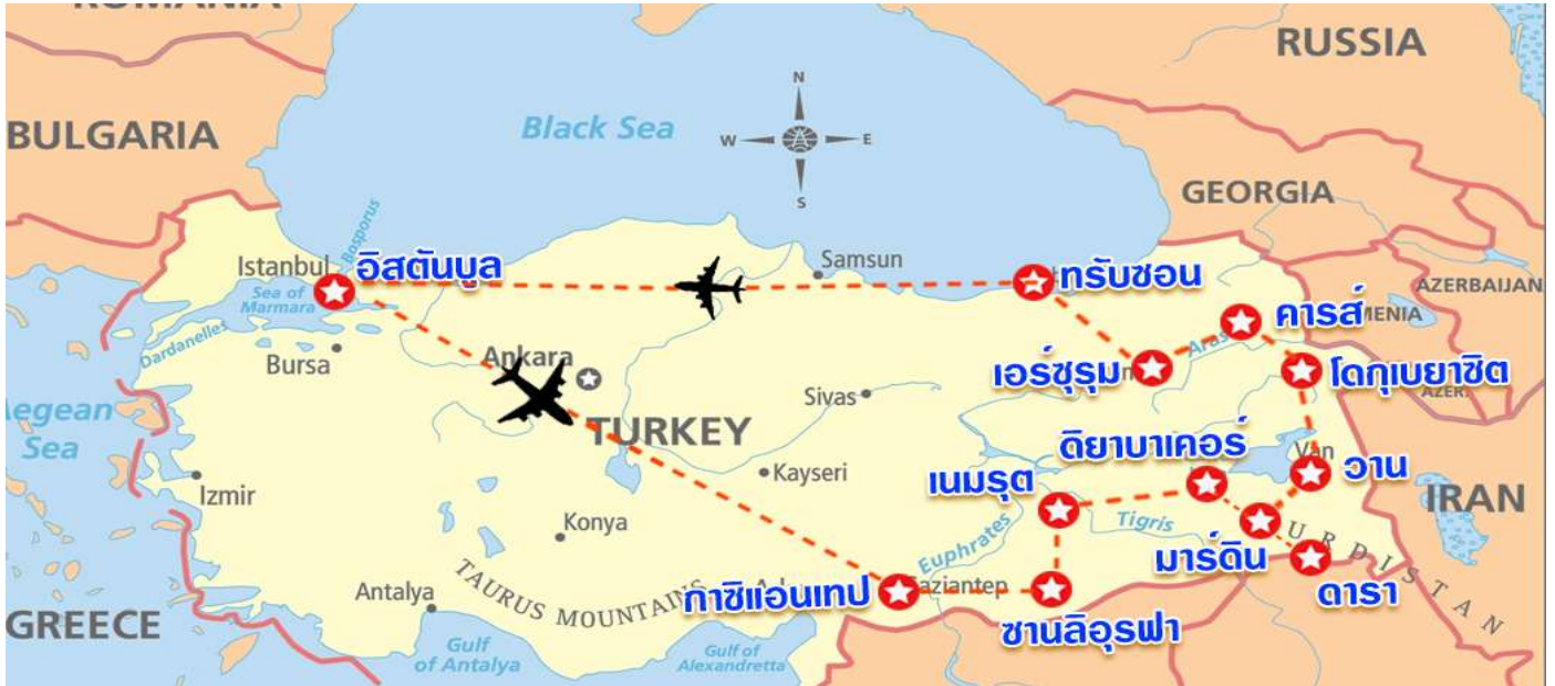
EASTERN TURKEY แสงแดด สายลม และผืนพรมแห่งทรายที่เมโสโปเตเมีย