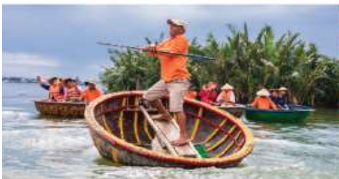
เรือกระดง