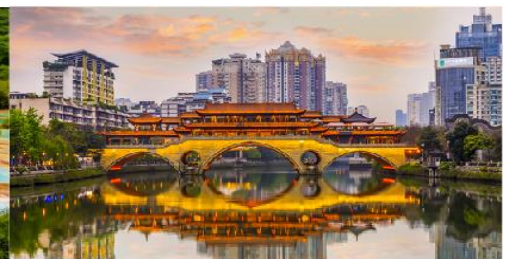
สะพานอันซุน