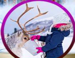
Sami Village Murmansk

นั่งรถไฟความเร็วสูง SAPSAN (เซนต์ปีเตอ์สเบิร์ก > มอสโก)