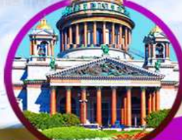
St. Isaac's Cathedral