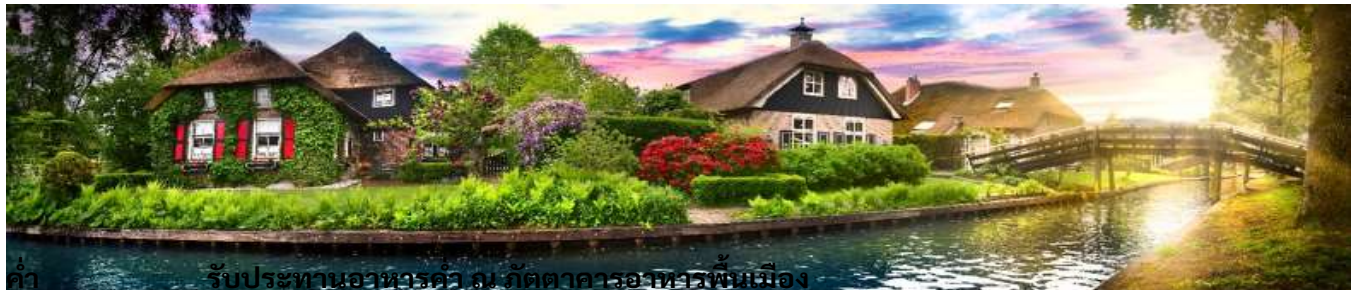
ค่า รับประทานอาหารค่ำ ณ ภัตตาคารอาหารพื้นเมือง

บ่าย นำท่านเดินทางสู่ “หมู่บ้านกีธูร์น” Giethoorn Village หมู่บ้านเล็กๆ แห่งหนึ่งในประเทศเนเธอร์แลนด์ (ใช้เวลาเดินทางประมาณ 3 ชั่วโมง) เป็นหมู่บ้านที่อาศัยการสัญจรทางน้ำเพียงอย่างเดียว จนได้ฉายาว่าเป็น “หมู่บ้านไรถนน” มีผู้คนอาศัยเพียงแค่ 2,600 กว่าคน แต่มีนักท่องเที่ยวไปเยือนนับล้านคน นำท่านนั่งเรือหมู่บ้านกีธูร์น เพื่อดื่มด่ำกับลำคลองน้ำใส เรือพายลำน้อย ต้นไม้ใบหญ้า และอากาศบริสุทธิ์ ซึ่งเป็นดั่งสวรรค์สำหรับการพักผ่อนแบบสโลว์ไลฟ์อย่างแท้จริง