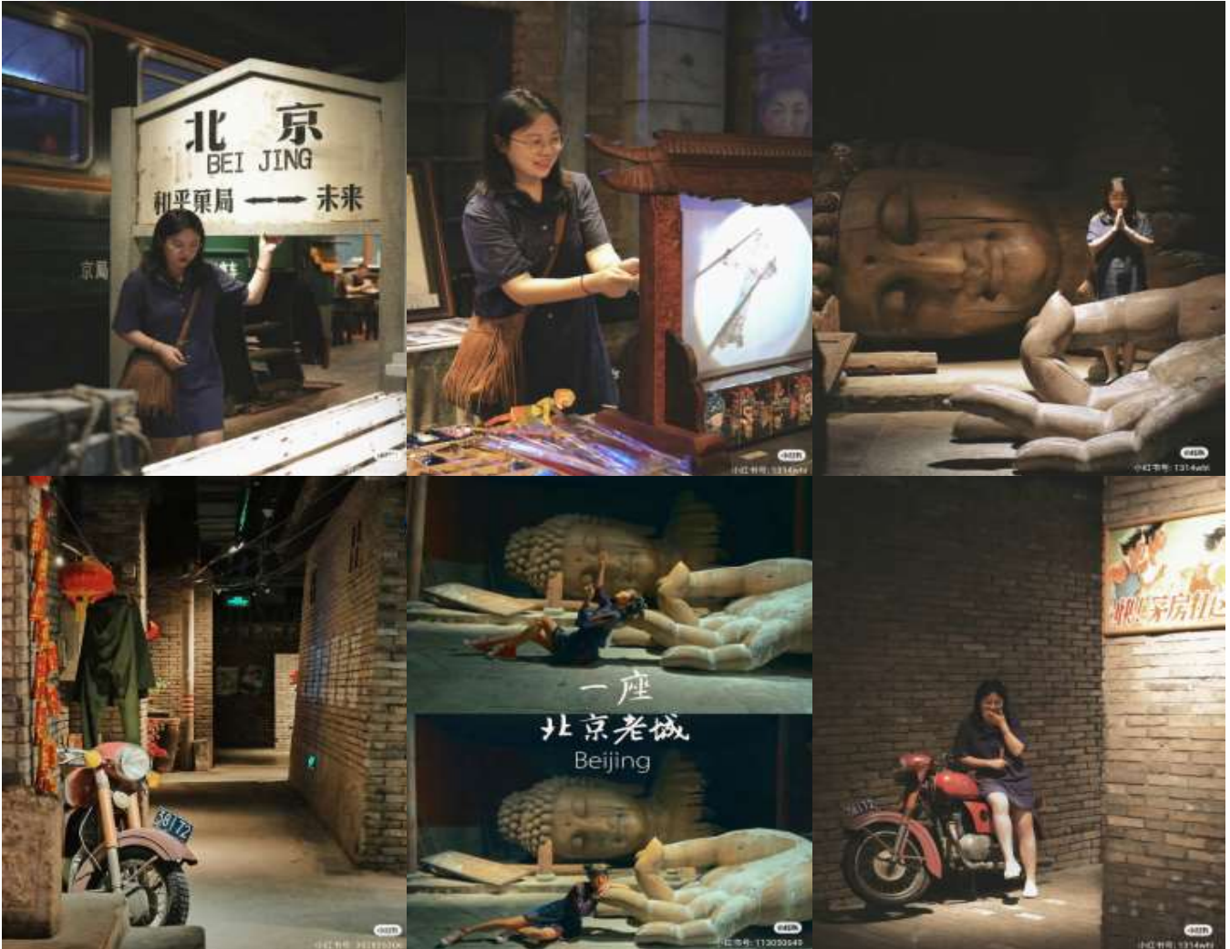
ขอบคุณเจ้าของภาพ (เครดิตตามภาพ)