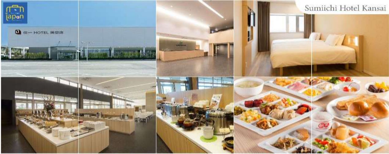
Sumiichi Hotel Kansai

วันที่สอง เมืองนารา – วัดโทไดจิ – สวนนารา – เมืองโอซาก้า – ศาลเจ้าสุมิโยชิ ไทชะ – ศาลเจ้านัมบะยาซากะ – ช้อปปิ้งชินไซบาชิ