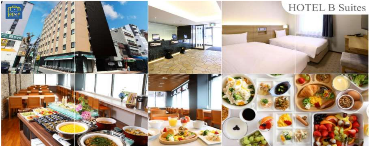
พักที่ HOTEL B SUITES NAMBA, OSAKA หรือเทียบเท่าระดับเดียวกัน