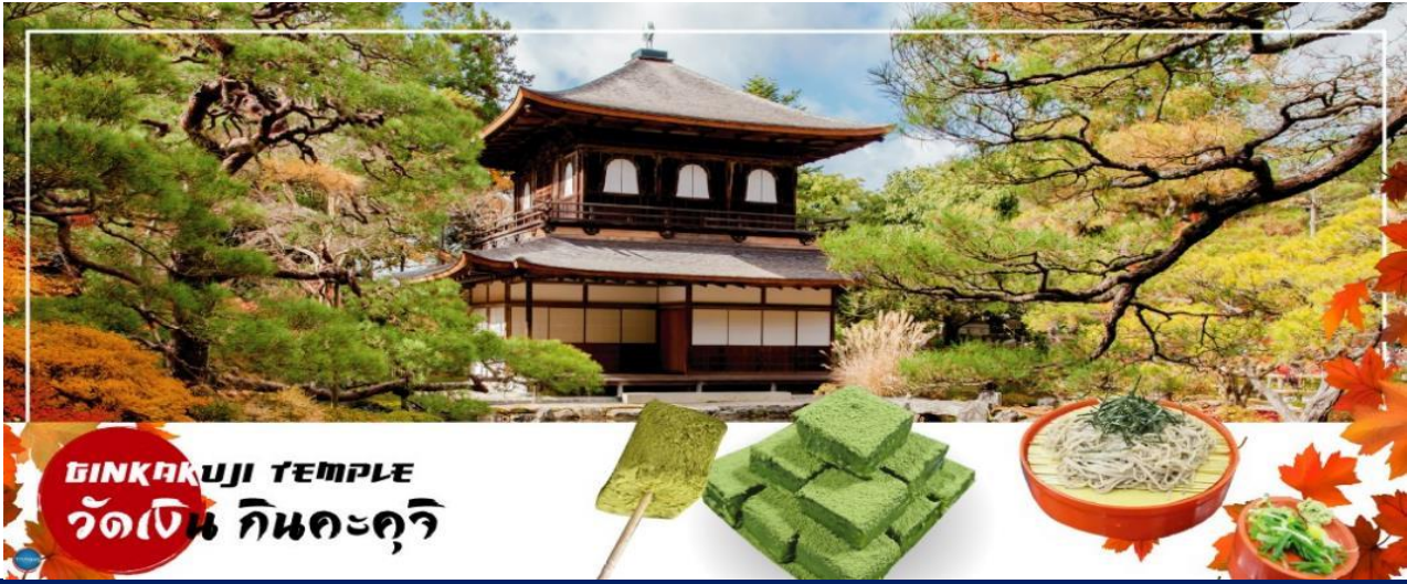
GINKAKUJI TEMPLE วัดเงิน กินคะคุจิ