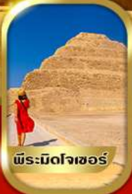
พีระมิดโจเซอร์