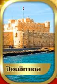
ป้อมปราการ