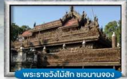
พระราชวังไม้สัก ฆวนานจง