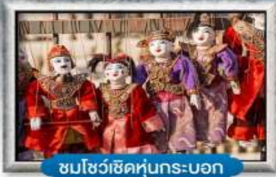
ชมโชว์เชิดหุ่นกระบอก