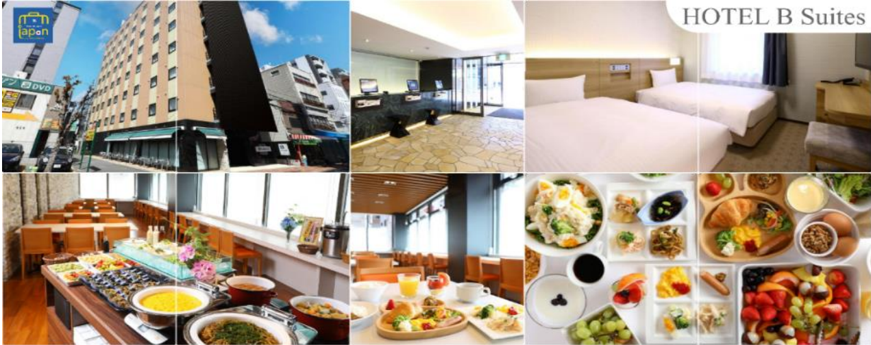
พักที่ HOTEL B SUITES NAMBA, OSAKA หรือเทียบเท่าระดับเดียวกัน

วันที่หก ทำอากาศยานนานาชาติคันไซ โอซาก้า ประเทศญี่ปุ่น – ทำอากาศยานนานาชาติ ดอนเมือง