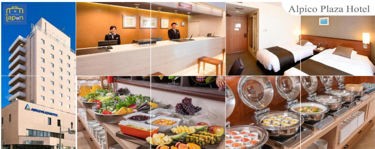
Alpicco Plaza Hotel