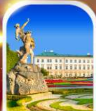
MIRABELL PALACE AUSTRIA