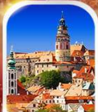
CESKY KRUMLOV CZECH