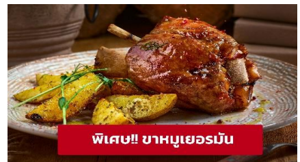
พิเศษ! ขาหมูเยอรมัน

จากนั้นนำท่านเที่ยวชม เมืองซูก (ZUG) ประเทศสวิตเซอร์แลนด์ (ระยะทาง 259 กม. / 3.45 ชม.) เป็นเมืองที่ร่ำรวยที่สุดในประเทศ และซูกเป็นเมืองที่ติดอันดับหนึ่งในสิบของโลกเมืองที่สะอาดที่สุด อิสระช้อปปิ้งที่ Lohri AG Store ที่มีนาฬิกาชั้นนำระดับโลกให้ท่านเลือกซื้อเลือกชม อาทิเช่น Patek Philippe, Franck Muller Cartier, Omega, Tag Heuer ฯลฯ