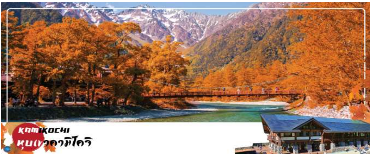
KAMIKOCHI หุบเขาคามิโคจิ

วันที่สาม เมืองนาగాโนะ – คามิโคจิ – สะพานกัปปะ – เมืองเซกิ – พิพิธภัณฑน์มิตซึซึชู – เมืองนาโกย่า – ซ้อปปิ้งย่านซาคาเอะ