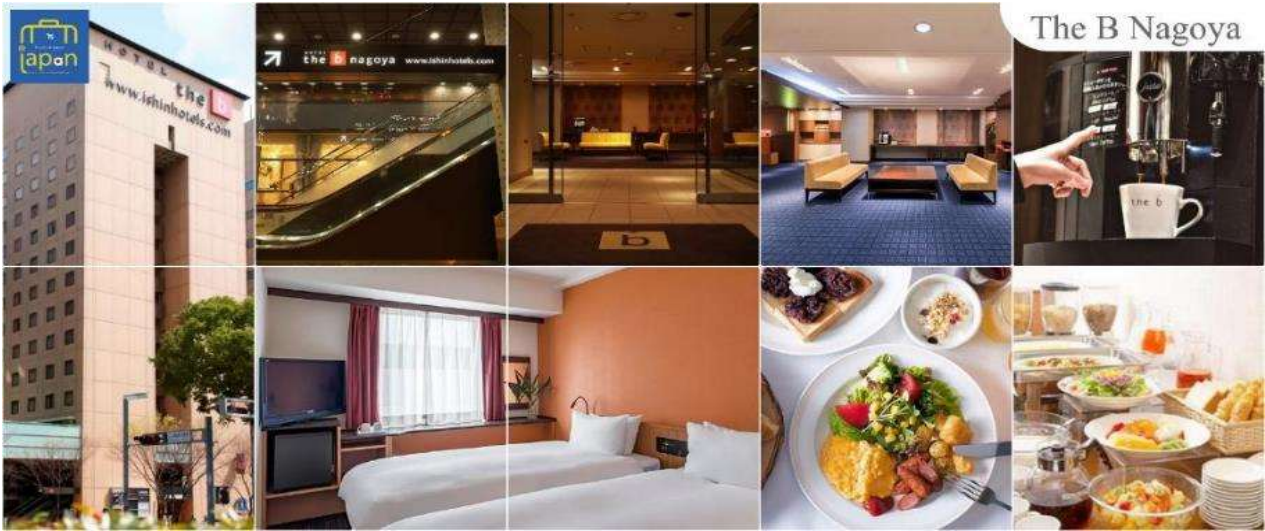
พักที่ HOTEL THE B NAGOYA หรือเทียบเท่าระดับเดียวกัน

วันที่สี่ เมืองนาโกย่า – เมืองเกียวโต – วัดกินคะคุจิ หรือ วัดเงิน – การเรียนพิธีชงชาญี่ปุ่น – ศาลเจ้าเฮอัน – เมืองนาโกย่า – แจ๊ซ ดริม เอ้าท์เล็ท