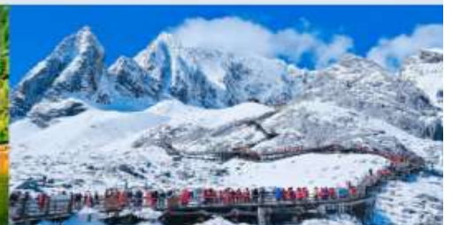
ภูเขาหิมะมิงกรหยก

*ทางบริษัทฯ ขอสงวนสิทธิ์ในการสลับโปรแกรมทัวร์ตามความเหมาะสมขึ้นอยู่กับสถานการณ์ปัจจุบัน โดยคำนึงถึงผลประโยชน์ของลูกค้าเป็นสำคัญ