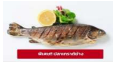
ปลาเทราต์ย่าง

นำท่านเดินทางสู่ เมืองมรดกโลกเชสกี ครุมลอฟ (Cesky Krumlov) สาธารณรัฐเช็ก (ระยะทาง 210 กม./ 3.30 ชม.) ล้อมรอบด้วยแม่น้ำ Vltava ทำให้เมืองแห่งนี้มีลักษณะคล้ายหยดน้ำ จนถูกขนานนามว่าเป็น "เมืองหยดน้ำ" จากนั้นนำท่านถ่ายรูปบริเวณรอบนอก ปราสาทครุมลอฟ (Cesky Krumlov Castle) เป็นปราสาทกอธิคดั้งเดิม ตั้งอยู่ริมฝั่งแม่น้ำวัลตาวาบนแหลมหิน มีหอคอยสีชมพูหวานๆ ราวกับปราสาทเจ้าหญิงในนิยาย มีอายุกว่า 700 ปี เคยเป็นคฤหาสน์ส่วนตัวของขุนนางถึง 3 ตระกูล ก่อนจะตกเป็นสมบัติของรัฐบาล