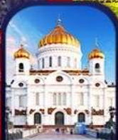
CHURCH OF CHRIST THE SAVIOUR