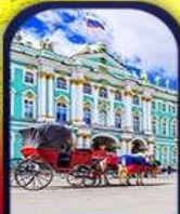
HERMITAGE WINTER PALACE