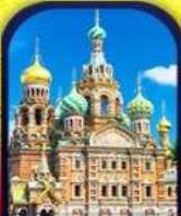
CHURCH OF THE SPILLED BLOOD