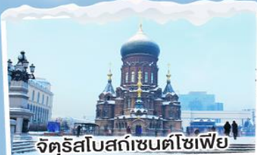
จัตุรัสโบสถ์เซ็นต์โซเฟีย