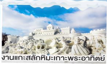
งานแกะสลักหิมะเกาะพระอาทิตย์

งานเทศกาล HARBIN ICE & SNOW FESTIVAL • หมู่บ้านหิมะ • งานแกะสลักหิมะ เกาะพระอาทิตย์ • ถนนรัสเซีย • จัตุรัสโบสถ์เซ็นต์โซเฟีย