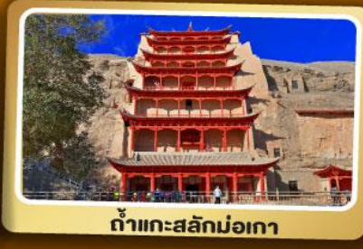
ถ้ำแกะสลักม่อเกา