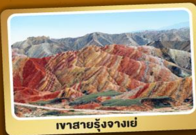
เวาสายรุ้งจางเย่