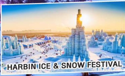
HARBIN ICE & SNOW FESTIVAL