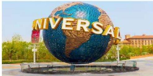
สวนสนุกยูนิเวอร์เซลปักกิ่ง รีสอร์ท