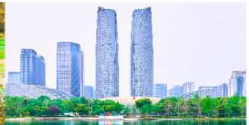
ตึกแฝดเจิงตุ

*ทางบริษัทฯ ขอสงวนสิทธิ์ในการสลับโปรแกรมทัวร์ตามความเหมาะสมขึ้นอยู่กับสถานการณ์ปัจจุบัน โดยคำนึงถึงผลประโยชน์ของลูกค้าเป็นสำคัญ