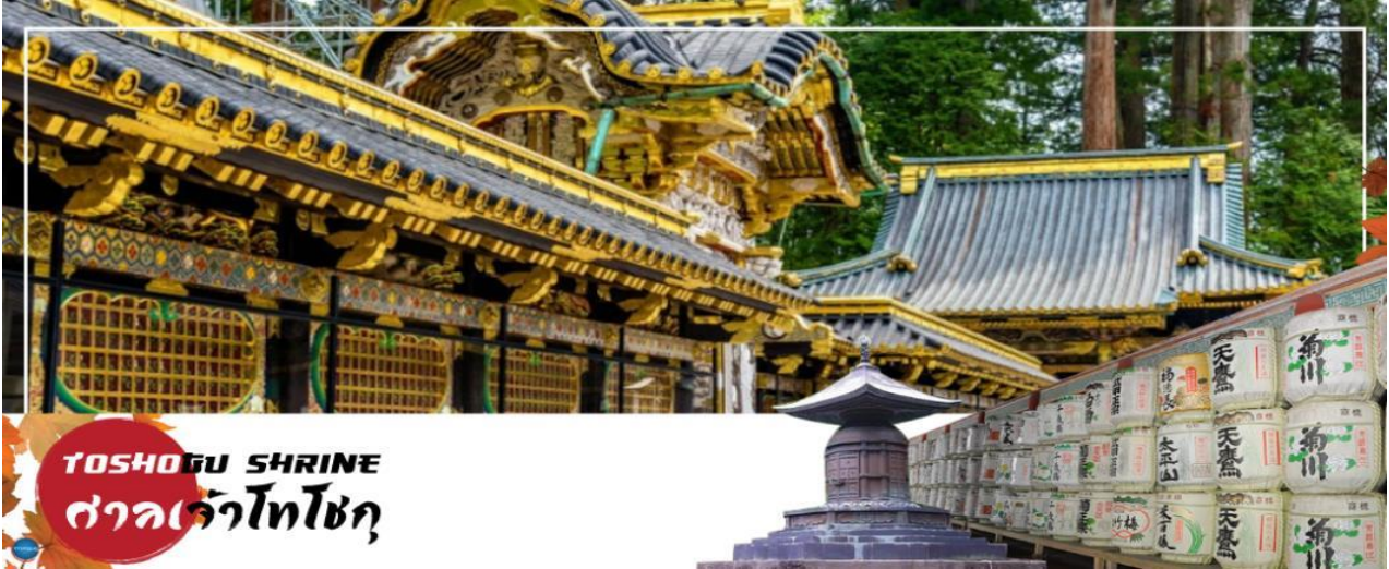
TOSHOGU SHRINE ศาลเจ้าโทโชกุ

วันที่สาม เมืองนิกโกะ - ผ่านชม สะพานชินเคียว - ศาลเจ้าโทโชกุ - ศาลเจ้าฟูตาระ - จังหวัดไซตามะ - ย่านเมืองเก่าคาวะโกเอะ - ตรอกลูกกวาด - เมืองยามานาชิ - ออนเซ็น + ชาบูยักษ์