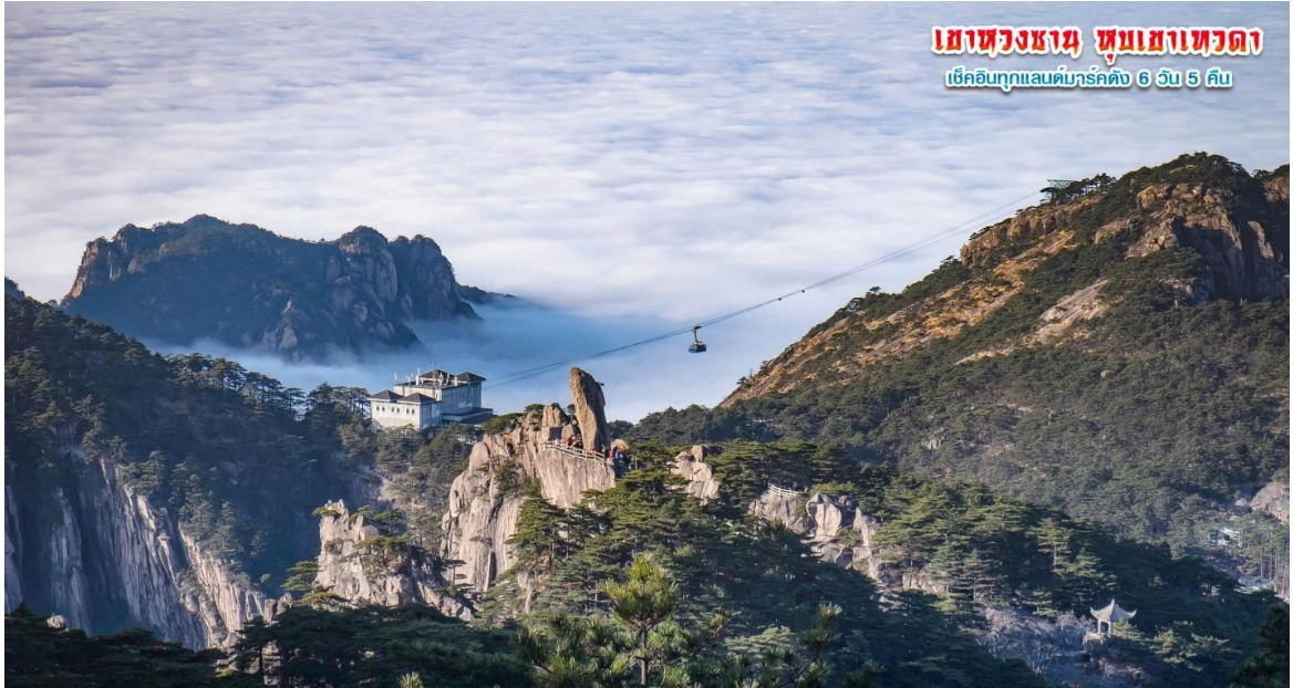
เขาหลวงซาม ซุมเขาเทวดา เคเบิลทุกแอนด์มาร์คคิง 6 วัน 5 คืน