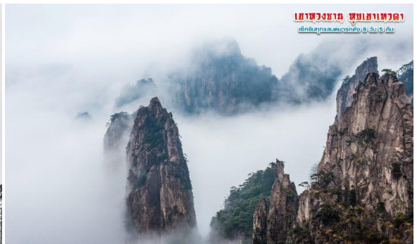
เขาหลวงซาม ซุมเขาเทวดา เคเบิลทุกแอนด์มาร์คคิง 6 วัน 5 คืน

จากนั้นนำท่านไปชมทิวทัศน์ “ ด้านซีไห่ ” ชมทะเลหมอก และจุดชมหินแปลกๆของเขางวงซาม ชมซีไห่แกรนด์แคนยอน จุดชมวิวที่เปิดในปี 2001 เริ่มต้นที่ศาลาชมเมฆ และสะพานนางฟ้า ความสูงถึง 1,664 เมตร เหนือระดับน้ำทะเล สำหรับผู้ที่ยังพอมีแรงเดินนั้น ตามเส้นทางยังมีภูเขาที่คดเคี้ยว เส้นทางใหม่ที่สามารถปีนขึ้นไปชมวิวอีกมากมาย ชมยอดเขาเมฆแดง ยอดแก้วมังกร ยอดดอกบัว เขาหินบินมา ต้นสนพันปี หินลิงมองทะเล ที่มีลักษณะเหมือนลิงกระโดดและมองทะเล สำหรับในช่วงฤดูหนาวเขาแห่งนี้จะปกคลุมไปด้วยหิมะที่ขาวโพลน และเมฆหมอก ที่ปกคลุมเขาทั้งหลาย ทำให้บรรยากาศเหมือนอยู่ในสรวงสวรรค์เลยทีเดียว