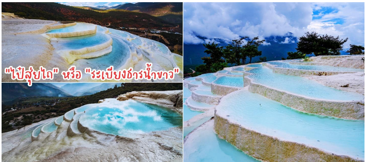
"ไป๋ส่วยไถ" หรือ "ระเปียงธารน้ำขาว"

นำท่าน สู่เมืองลีเจียง ระหว่างทางชม ชวนชมธรรมชาติอันงดงามของ "ไป๋ส่วยไถ" หรือ "ระเปียงธารน้ำขาว" ซึ่งตั้งอยู่บนความสูงเหนือระดับน้ำทะเล 2,380 เมตร และครอบคลุมพื้นที่ประมาณ 3 ตารางกิโลเมตร ในตำบลซานป้า เมืองเซียงเก้อหลี่ลาหรือแซงกรีลา มณฑลฉวนหนาน (ยูนนาน) ทางตะวันตกเฉียงใต้ของจีนระเปียงธารน้ำขาวแห่งนี้ก่อตัวขึ้นจากการตกสะสมตัวของแคลเซียมคาร์บอเนตในน้ำที่ไหลจากน้ำพุ สร้างเป็นทิวทัศน์ความมหัศจรรย์ทางธรรมชาติจวบจนปัจจุบัน ทั้งยังได้รับสมญานามว่า "สถานที่ที่เมฆขาวทิ้งร่องรอยบนโลกา"