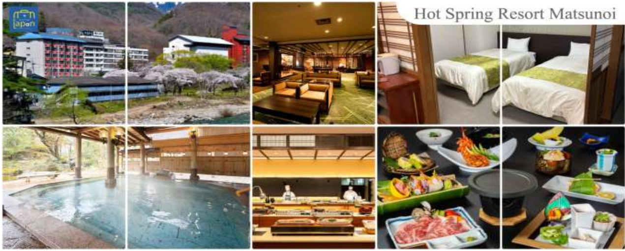
Hot Spring Resort Matsunoi