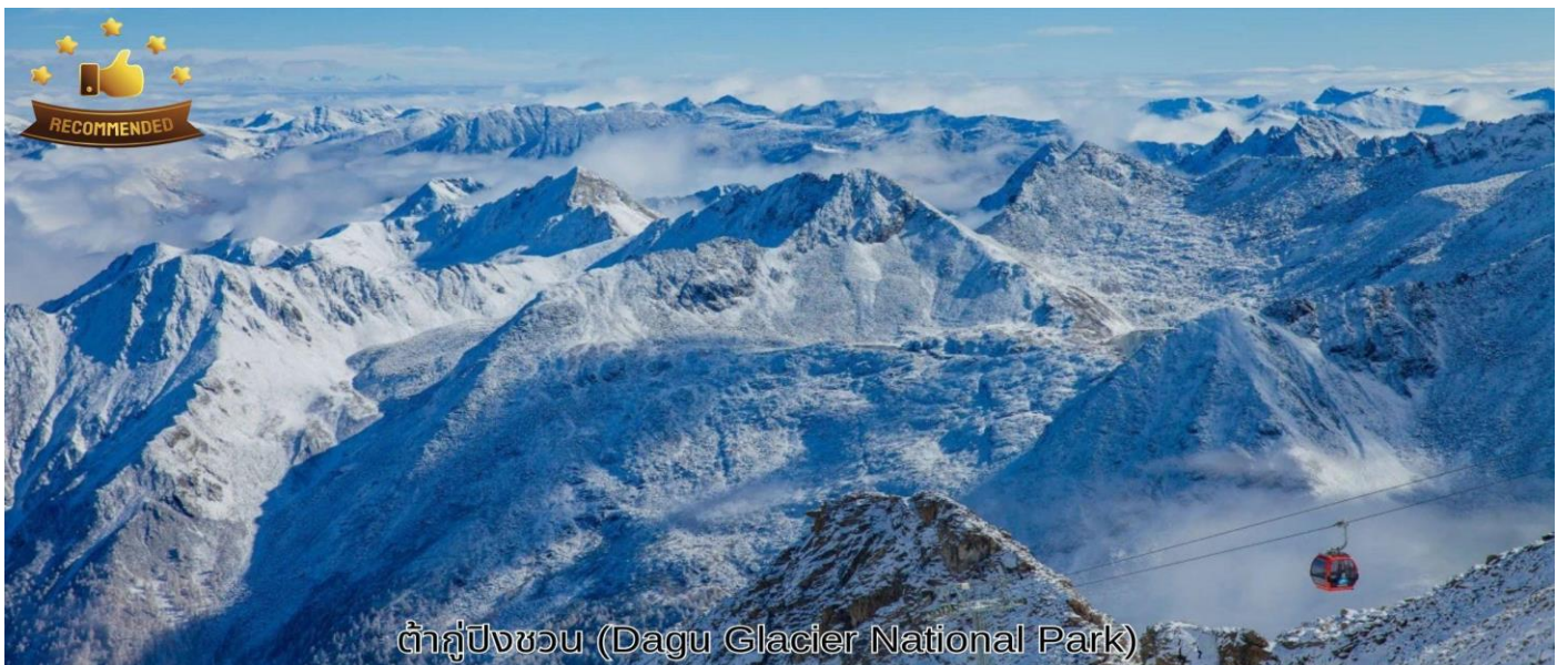
ต้ากู่ปิงชว่น (Dagu Glacier National Park)

นำท่านเดินทางสู่ อุทยานต้ากู่ปิงชว่น (Dagu Glacier National Park) ใช้เวลาเดินทางประมาณ 3 ชั่วโมง ตั้งอยู่ที่เมืองเฮย์ชุย (Heishui) ในมณฑลเสฉวน เป็นอุทยานทางธรรมชาติระดับ 4A ที่มีความสวยงามของภูเขาหิมะ และทะเลสาบบนยอดเขาที่มีความสูงจากระดับน้ำทะเลประมาณ 5,286 เมตร ถูกค้นพบผ่านดาวเทียมเมื่อปี ค.ศ. 1992 โดยนักวิทยาศาสตร์ชาวญี่ปุ่น หลังจากได้ตรวจสอบพื้นที่จึงทราบว่าที่เป็นธารน้ำแข็งที่ตั้งอยู่ต่ำที่สุด ใหญ่ที่สุด และยังอายุน้อยที่สุดในโลกอีกด้วย เป็นธารน้ำแข็งที่งดงามที่สุด ซึ่งก่อตัวมาเป็นเวลาหลายร้อยล้านปี