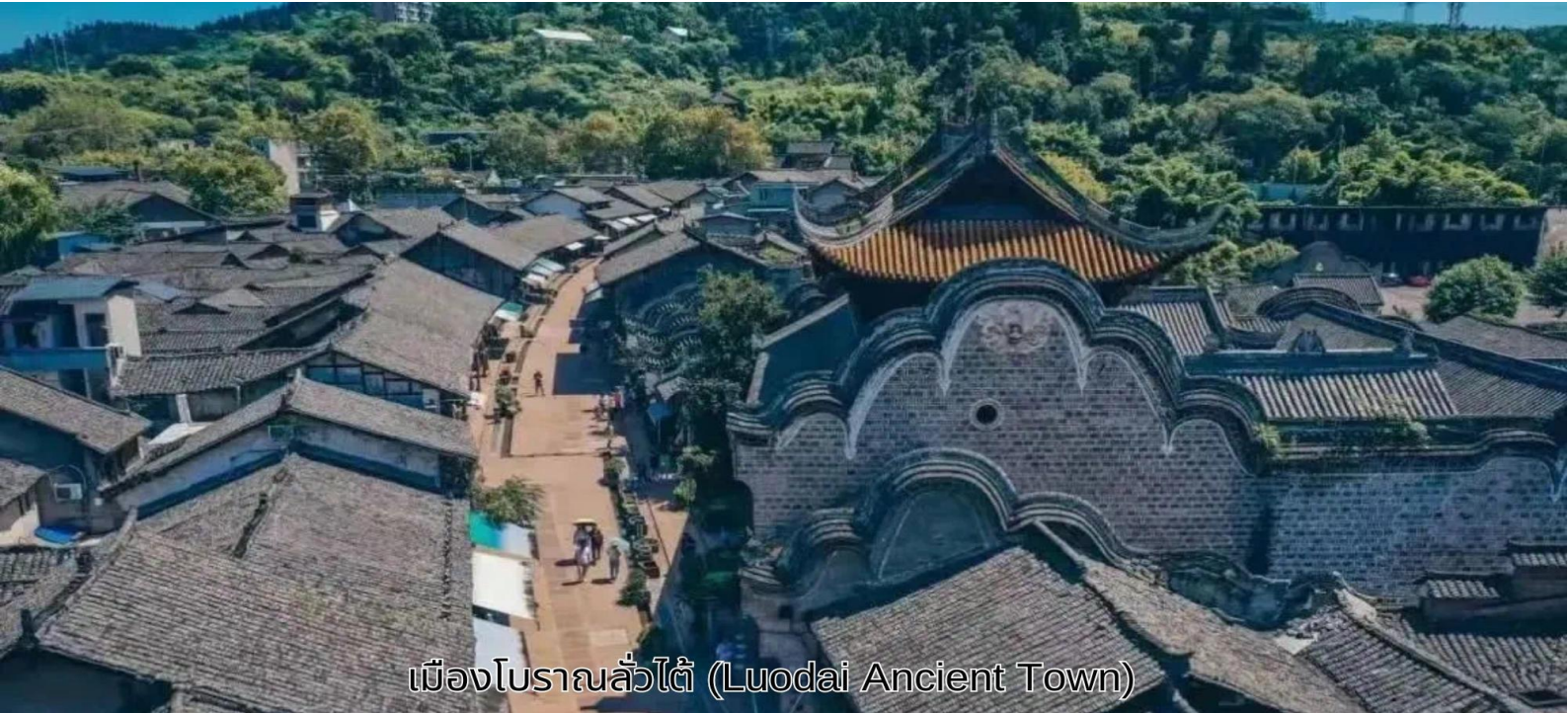
เมืองโบราณลั่วไต้ (Luodai Ancient Town)

สมควรแก่เวลา นำท่านเดินทางสู่ สนามบินเมืองเทียนฟู เดินทางกลับสู่ ประเทศไทย