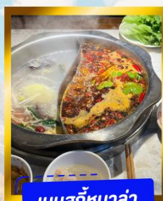
เมนูสุกี่หม่าล่า