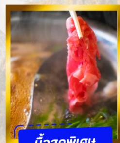
มือสุดพิเศษ