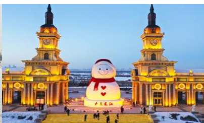
ตุ๊กตาทิมะยักซ์