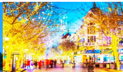
ถนนมายิ่งลุ

วันที่ห้า เมืองฮาร์บิ้น - โบสถ์โซเฟีย - อนุสาวรีย์ป้องกันอุทกภัย - ถนนจยงยังลุ - นั่งรถไฟความเร็วสูงกลับเมืองต้าเหลียน - จัตุรัสชิงไห่ - ถนนรัสเซีย