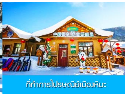
ที่ทำการไปรษณีย์เมืองหิมะ

วันที่สี่ พิพิธภัณฑ์เมืองหิมะ – ที่ทำการไปรษณีย์เมืองหิมะ – ไกด์ขายออฟชั่นภาพเขียนลึบลี่และออฟชั่นม้าลากเลื่อน-เมืองฮาร์บิน