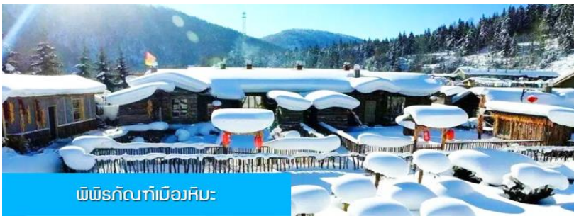
พิพิธภัณฑ์เมืองหิมะ