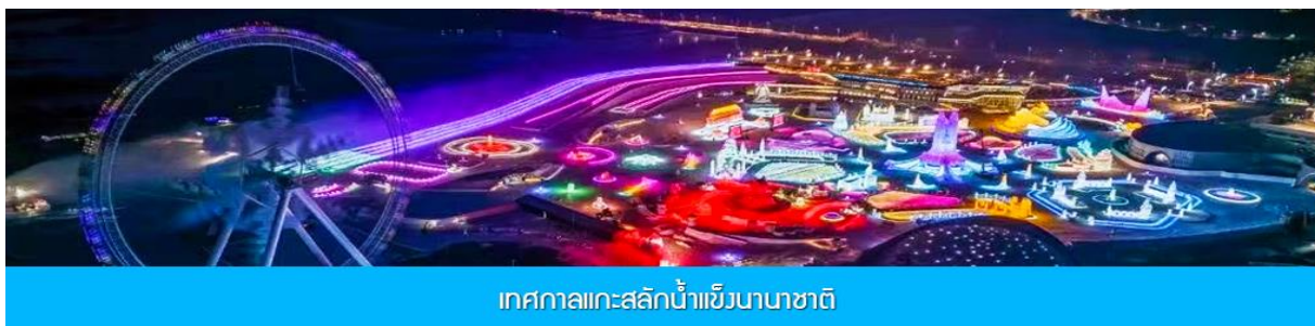
เทศกาลแกะสลักน้ำแข็งนานาชาติ

รับประทานอาหารค่ำ ณ ภัตตาคาร *เมนูพิเศษ เกี่ยวฮาร์บิน