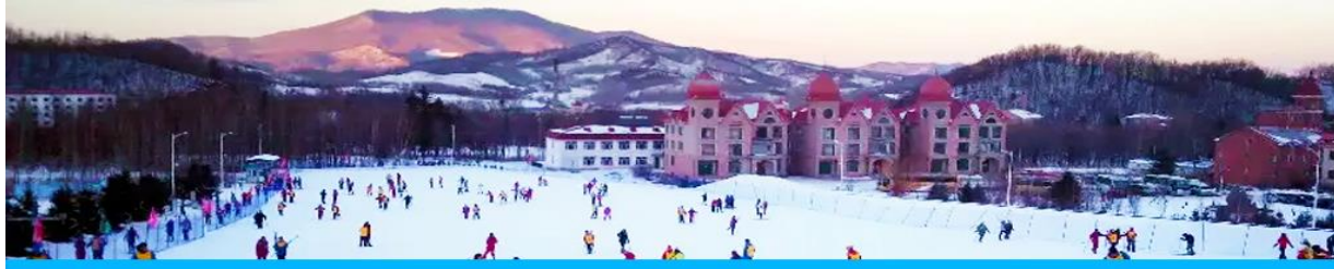
ลานสกียาบูลิ

วันที่สาม เมืองฮาร์บิน-ลานสกียาบูลิ - ชมการจับปลาในฤดูหนาว - หมู่บ้านหิมะ Snow Town - ระเบียบง ชมวิวเขาปังกูยซาน- เมืองหิมะยามราตรี