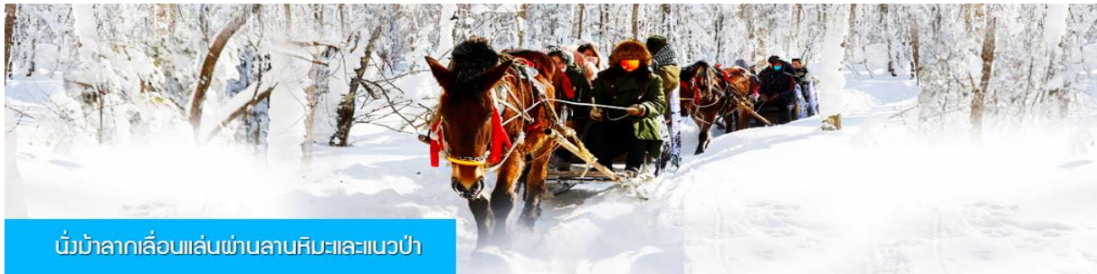
นั่งม้าลากเลื่อนเล่นผ่านลานหิมะและแนวป่า

รายการที่ 2 นั่งม้าลากเลื่อนผ่านลานหิมะและแนวป่า 马拉雪橇 ท่ามกลางสิ่งแวดล้อมของหิมะราวกับอยู่ในโลกแห่งเทพนิยาย ผ่านหมู่บ้าน เว่ยหูจ้าย 威虎寨 ที่อดีตเคยเป็นที่ตั้งของรังโจรที่มักออกปล้นสะดมชาวบ้าน ม้าลากเลื่อนเป็นยานพาหนะเฉพาะพื้นที่ ๆ ได้รับความนิยมมากในอดีต การเดินทางในช่วงฤดูหนาวต้องใช้ม้าลากจูงลากเลื่อนให้สามารถวิ่งเล่นบนลานหิมะได้ โดยลากเลื่อนที่มีม้าเป็นตัวลากจูงสามารถฝ่าเสียงได้ทั้งผู้คน และข้าวของเสบียงต่าง ๆ ...เวลาที่ใช้สำหรับโปรแกรมเสริมนี้ประมาณ 40 นาที อัตราค่าบริการ ท่านละ 240 หยวน หรือ 1200 บาท อัตรานี้รวมค่าบริการผ่านเข้าอุทยาน ค่ารถรับ ส่ง และค่าบริการของไกด์ท้องถิ่น และค่าบริการจัดการของบริษัททัวร์ท้องถิ่น... หมายเหตุ โปรแกรมเสริมเป็นโปรแกรมที่ท่านต้องเสียค่าใช้จ่ายเองด้วยความสมัครใจ สำหรับท่านที่ไม่เข้าร่วมกิจกรรมดังกล่าวสามารถนั่งพักในรถได้