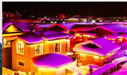
เมืองหิมะ: Xue xiang