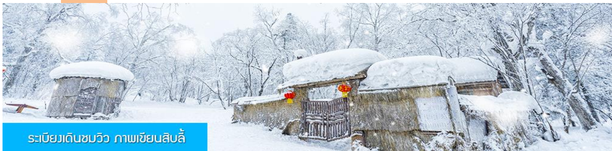
ระเบียบเดินชมวิว ภาพเขียนลึบลี่

เที่ยง รับประทานอาหารกลางวัน ณ ภัตตาคาร หลังอาหารนำท่านเดินทางกลับเมืองฮาร์บิน (ใช้เวลาเดินทางโดยรถบัสราว 5 ชั่วโมง) ระหว่างทางไกด์ท้องถิ่นจะเสนอขายโปรแกรมเสริมที่ไม่ได้รวมในค่าทัวร์ (ออฟชั่นแนล ทัวร์) 2 รายการ