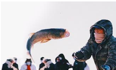
การจับปลาในฤดูหนาว

นำท่านชม การจับปลาในฤดูหนาว 冬捕 เป็นวิธีการจับปลาตามแม่น้ำและแหล่งน้ำในฤดูหนาวที่สืบทอดกันมายาวนาน โดยชาวบ้านจะนำแหตักปลามาวางดักไว้ตามจุดต่าง ๆ ก่อนที่ผิวน้ำจะปกคลุมด้วยน้ำแข็ง หลังจากผิวน้ำกลายเป็นน้ำแข็งแล้ว ชาวบ้านจะเจาะพื้นน้ำแข็งบริเวณที่มาแหวางดักอยู่เพื่อยกแหขึ้น จะมีปลาติดแหเป็นจำนวนมาก...พิเศษ ให้ท่านได้ชมการยกแหตักปลาจากสถานที่จริงและให้ท่านได้ชิมซูชิเนื้อปลาสด ๆ ที่ได้จากแหตักปลา