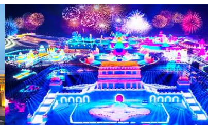
เทศกาลแกะสลักน้ำแข็งนานาชาติ