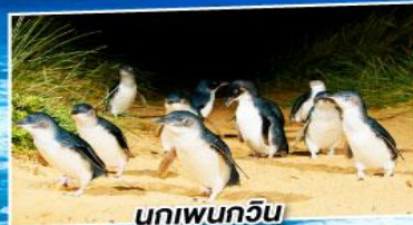
นกเพนกวิน