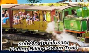
รถไฟจักรไอน้ำโบราณ Puffing Billing Stream Train