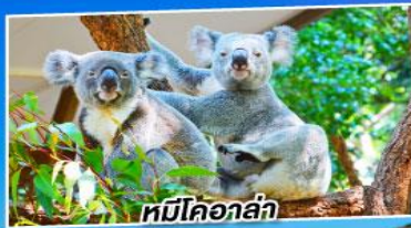
หมีโคอาล่า