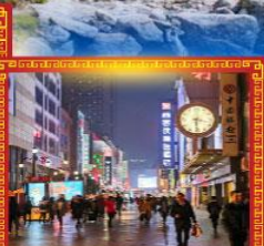
ถนนชุนชู่