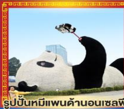
รูปปั้นหมีแพนด้าอนเซลฟ์