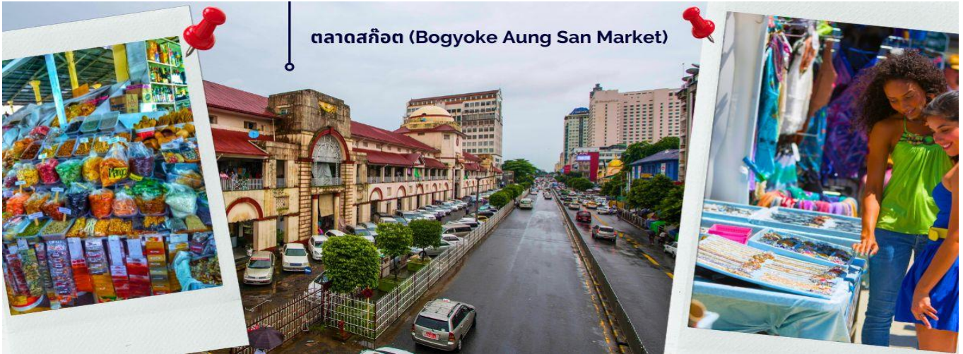
ตลาดสก๊อต (Bogyoke Aung San Market)

ให้ท่านได้มีเวลากับการเลือกซื้อของฝาก ของที่ระลึกต่างๆ ทั้งสินค้าพื้นเมืองที่มีชื่อเสียงของพม่าที่ ตลาดสก๊อต (Bogyoke Aung San Market) นี่คือนครที่ใหญ่ที่สุดในย่างกุ้ง เป็นแหล่งช้อปปิ้งที่มีสินค้าวางขายแทบทุกชนิด เปรียบเสมือนตลาดนัดจตุจักรของบ้านเราก็คงได้ นอกจากสินค้าพื้นเมืองแล้ว ตลาดแห่งนี้ยังเป็นแหล่งรวมสินค้าประเภทอัญมณีที่เป็นที่รู้จักไปทั่วโลกนั่นคือ หยกพม่า (หากซื้อสินค้าหรืออัญมณีที่มีราคาสูง ควรขอใบเสร็จรับเงินทุกครั้ง เนื่องจากจะต้องแสดงให้เห็นเจ้าหน้าที่ศุลกากรหากมีการขอตรวจสอบ)