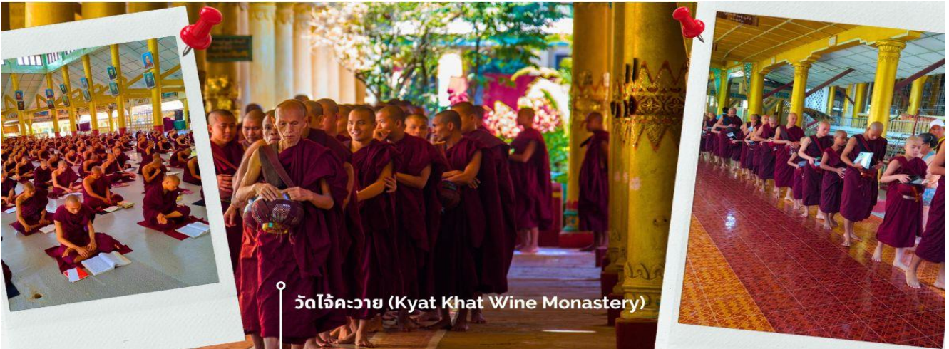
วัดไจ้คะวาย (Kyat Khat Wine Monastery)

นำท่านเดินทางลงจากพระธาตุอินทร์แขวน โดยใช้เส้นทางเดิม เพื่อมุ่งหน้าสู่เมืองหงสาวดี (ใช้เวลาเดินทางประมาณ 1 ชั่วโมง 30 นาที) เชิญร่วมทำบุญตักบาตรพระสงฆ์ ณ วัดไจ้คะวาย เมืองหงสาวดี มีพระสงฆ์กว่า 1000 รูป เป็นโรงเรียนสอนพระพุทธศาสนา นักธรรมชั้นตรี โท และ เอก เพื่อศึกษาพระไตรปิฎกเป็นจำนวนมาก ในช่วงสายของทุกวัน พระสงฆ์และเณร จะเดินออกมาบิณฑบาตเพื่อเตรียมฉันเพล โดยวัดแห่งนี้ได้รับการสนับสนุนจากชาวพุทธในพม่าเองและ นักท่องเที่ยวที่เดินทางมาที่วัด เพื่อทำการถวายเงินปัจจัย หรือข้าวสาร รวมไปถึง อุปกรณ์การเรียนและเครื่องเขียนต่างๆ เพื่อใช้ในการศึกษาธรรมะของพระสงฆ์และเณรในวัดไจ้คะวายแห่งนี้