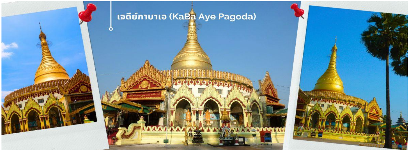
เจดีย์กาบาเอ (KaBa Aye Pagoda)

จากนั้นนำท่าน เดินทางไปยัง เจดีย์กาบาเอ (KaBa Aye Pagoda) เพื่อร่วมพิธี เทินพระธาตุ พิธีอันศักดิ์สิทธิ์ เป็นเจดีย์ทรงกลมครึ่ง ซึ่งมีทางเข้าทั้งหมดห้าด้านด้วยกัน นายอนุนายกคนแรกของพม่า ได้สร้างขึ้นเพื่อใช้เป็นสถานที่ชำระพระไตรปิฎก สูง 34 เมตร สร้างขึ้นเมื่อปี 1952 เพื่อทำการสังคายนาพระไตรปิฎกครั้งที่ 6 เป็นเจดีย์ที่มีความสวยงามและแปลกตา ภายในบรรจุพระอัฐิธาตุของพระอัครสาวกแห่งองค์พระสัมมาสัมพุทธเจ้า คือพระโมคคัลลานะและพระสารีบุตร จะมีทางเข้าทั้งหมดห้าด้าน ทุกด้านมีพระพุทธรูปประดิษฐานอยู่บนฐานทักษิณ มีพระพุทธรูปหุ้มด้วยทองคำองค์เล็กๆอีก 28 องค์