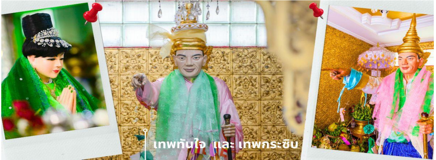
เทพทันใจ และ เทพกระซิบ