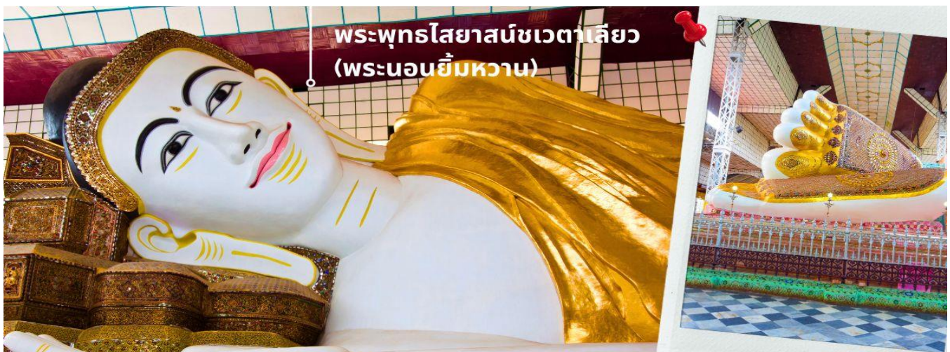
พระพุทธไสยาสน์ชเวตาเลียว (พระนอนยี่มหวาน)

🍲 รับประทานอาหารกลางวัน ณ ภัตตาคาร (4) เมนูพิเศษ!! กุ้งแม่น้ำเผา ท่านละ 1 ตัว พระพุทธไสยาสน์ชเวตาเลียว เป็นปูชนียสถานศักดิ์สิทธิ์อันดับสองของเมืองหงสาวดี รองจากมหาเจดีย์มูเตตา หรือที่คนไทยรู้จักกันในชื่อ "พระนอนยี่มหวาน" พระนอนชเวตาเลียว หรือ พระพุทธไสยาสน์ชเวตาเลียว มีอายุเก่าแก่กว่า ๑,๒๐๐ ปี คนไทยรู้จักในนาม พระนอนยี่มหวาน เนื่องจากพระพักตร์ของท่านได้รับการวาดตกแต่งไว้อย่างสวยงามพร้อมด้วยรอยยิ้มหวาน องค์พระเป็นศิลปะแบบมอญ ท่านสามารถที่จะเลือกหา เครื่องไม้แกะสลัก ที่มีให้เลือกมากมาย ตลอดสองข้างทางที่จะเดินเข้าไปสักการะองค์พระนอน และสินค้าพื้นเมืองอื่นๆ อาทิเช่น ผ้าพม่า ของที่ระลึกต่างๆอีกมากมาย