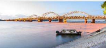
สะพานชงฮวาเจียง