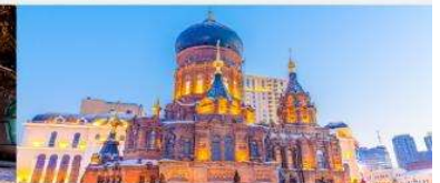
โบสถ์เซนต์ไอเซเฟีย

*ทางบริษัทฯ ขอสงวนสิทธิ์ในการสลับโปรแกรมทัวร์ตามความเหมาะสมขึ้นอยู่กับสถานการณ์หน้างาน โดยคำนึงถึงผลประโยชน์ของลูกค้าเป็นสำคัญ