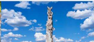
สวนประติมากรรมโลกฉางชุน