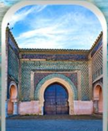
KASBAH OF MOULAY ISMAIL