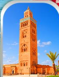
JEMAA EL-FNAA MARRAKESH