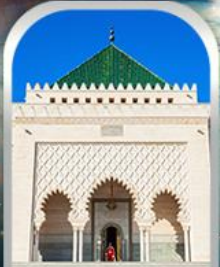
MOHAMMED V SQUARE