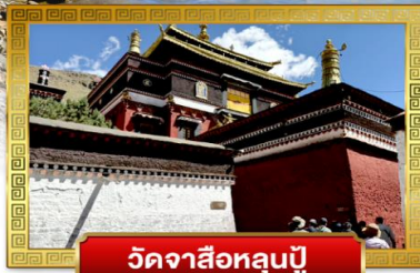
วัดจาซือหลุนปู