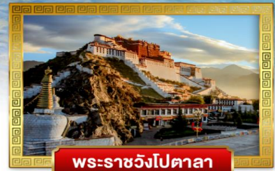
พระราชวังโปตาลา