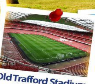
Old Trafford Stadium